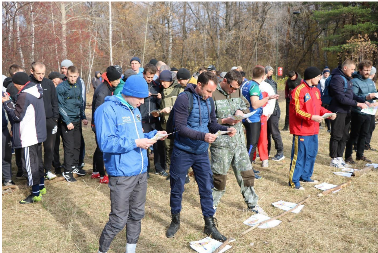
Участники соревнований по спортивному ориентированию среди учителей г. Тюмени 2019 г.

Спортивные организаторы 30 школ города Тюмени, отвечающие за подготовку команд к соревнованиям по спортивному ориентированию