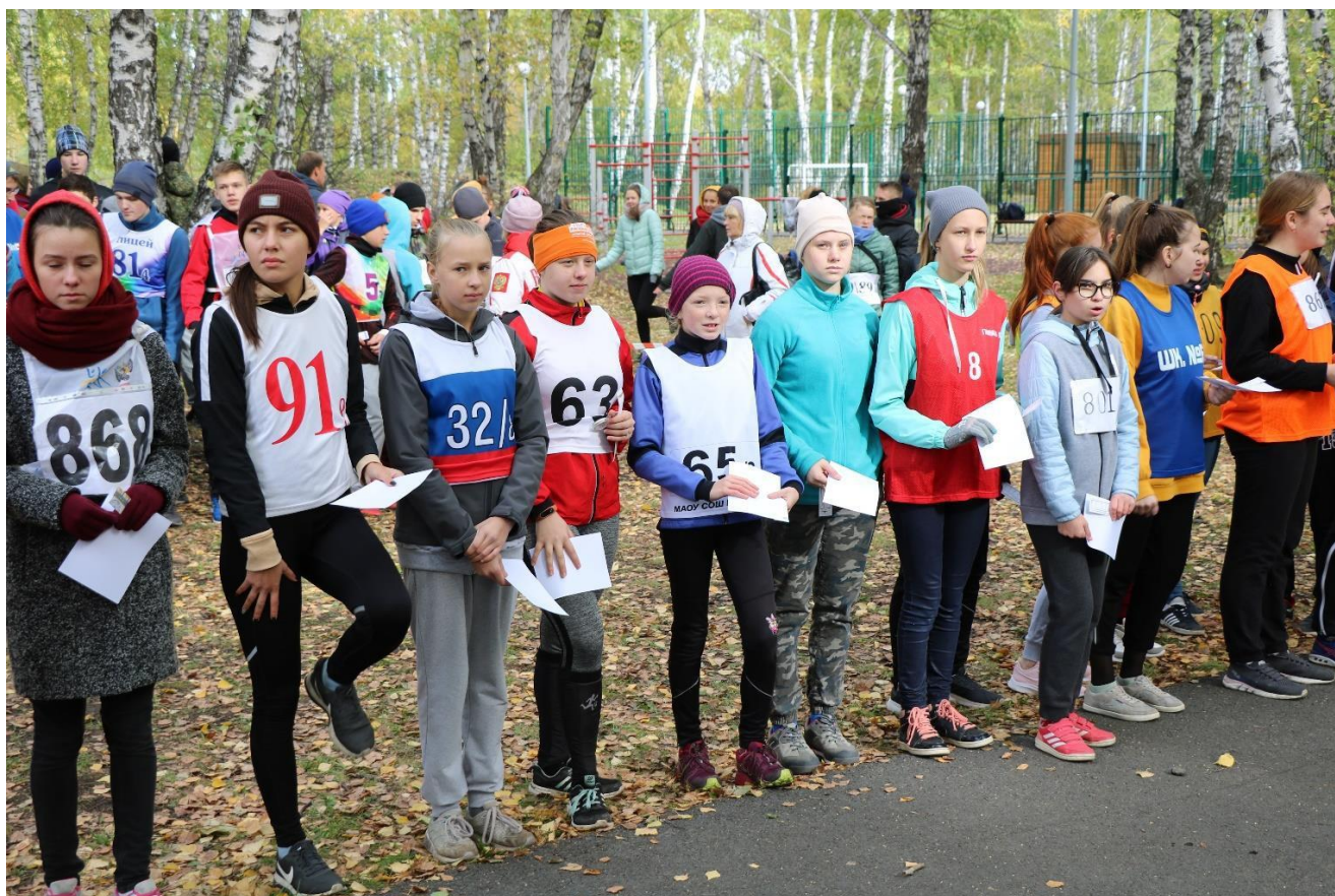
Участники Спартакиады учащихся города Тюмени по спортивному ориентированию 2019 года

Учащиеся 5-11 классов 10 общеобразовательных школ города Тюмени, участвующих в проекте